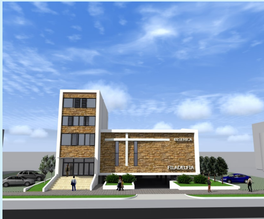
◀ Proiectul noii clădiri a bisericii Filadelfia

Dumnezeu să binecuvânteze această casă de rugăciune, un loc unde Duhul Sfânt coboară și unde oamenii se întâlnesc cu Dumnezeu! ■ L. G.