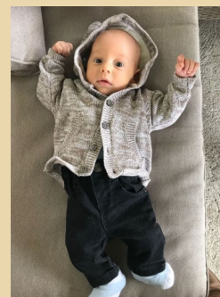
▲ IOSUA Lakatos

patriarhului Iacov cu prima sa soție, Lea. Ruben era primul lor copil, considerat de Lea o mângâiere trimisă de Dumnezeu pentru familia lor.